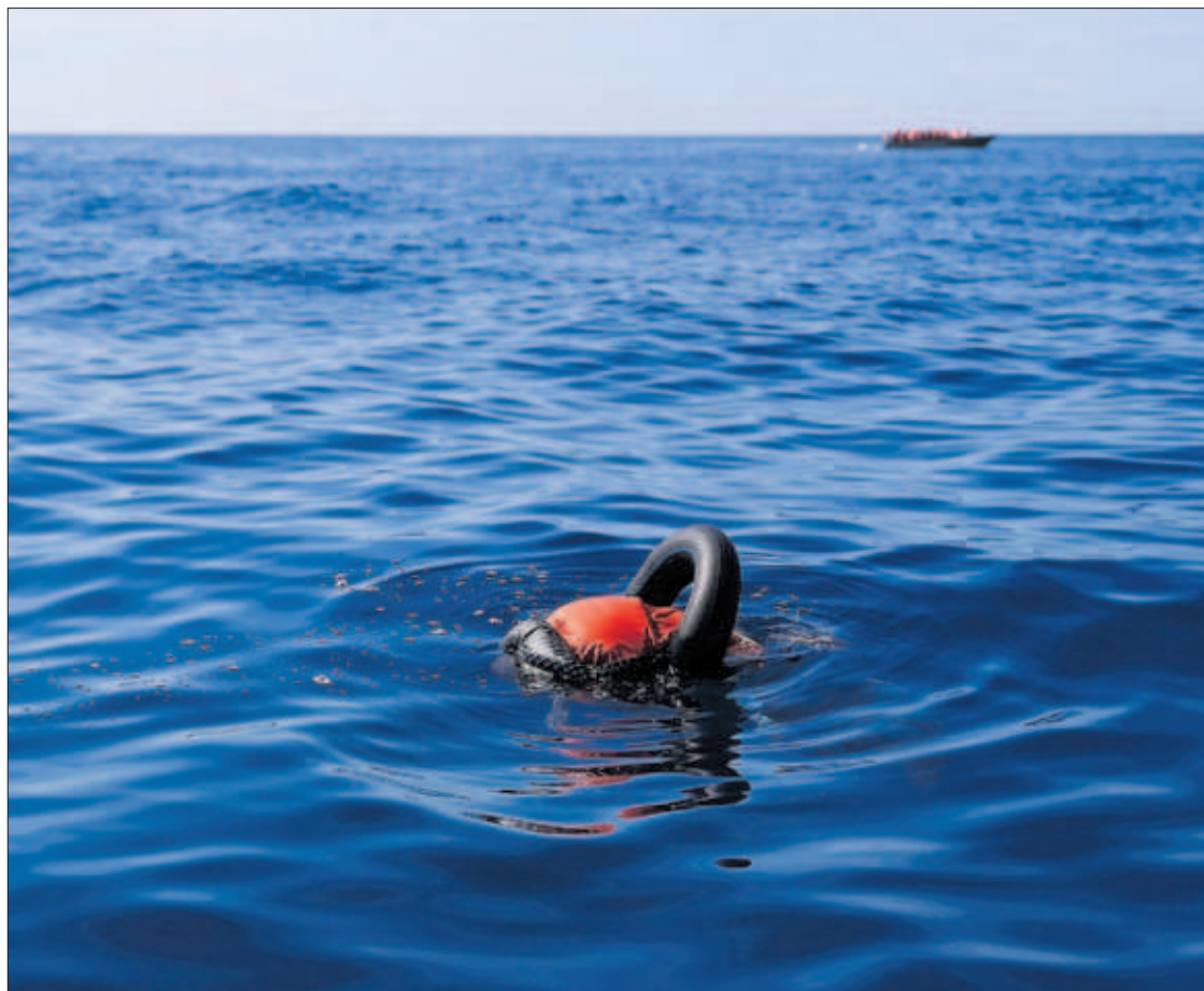
El cadáver de un hombre flotaba en el Mediterráneo, en aguas maltesas, el pasado jueves.

El mundo afronta una masiva transformación del empleo P42