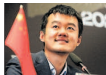
El ajedrecista Liren Ding.

dose al vacío con menos de dos minutos en el reloj en una posición diabólica. Su arrojo paralizó al ruso Ian Niepómniashi, que esperaba tablas. PÁGINA 38